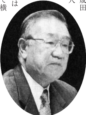
利光松男 （日本航空社長）

浜に及ばず二位になりましたが、金額ベースで横浜港と日本一を争っております。世界の主要空港の中でも貨物の取扱量で、ここ数年、成田は第一位の座を譲っておりません。最先端の電子機器から日常の食卓にのぼる食料品に至るまで、ありとあらゆるものが成田の貨物上屋を通過していきます。今や国際航空貨物は、旅客輸送の脇役ではなく、それ自身が我が国の経済社会の中で極めて重要な位置を占めるに至っております。このように国際航空輸送は旅客、貨物の両分野で、国民の皆様の生活に密着した、なくてはならない公共交通機関に成長してまいりました。