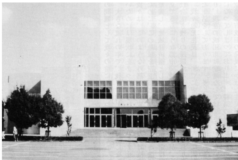
芝山町「芝山文化センター」

私は自分の問題としてそうした侵害を受けることがなかったわけですので、何とも言いようのない気分でございますが、一言指摘するとすれば、ご指摘のお上意識や差別意識も変わりつつあるのではないかと感じられることであります。確かに二十五年前は、ご指摘の部分が強かったかもしれません。しかし、これらの